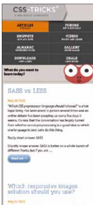
Landscape Smartphone und kleiner (Bild 6)

Oft sind Inhaltselemente mit einem float: left; versehen oder zum Beispiel Navigationen mit Icons ergänzt. Wie auch immer gestaltet, stellt sich dann die Notwendigkeit, das Design auf ein kleineres Layout anzupassen. Hier kommen die Media Queries ins Spiel. Schon seit CSS 2.1 gibt es in Stylesheets ein gewisses Bewusstsein für Endgeräte durch die Eigenschaft der Media