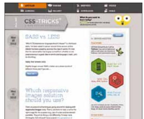
Mittlere Darstellung für Desktop-PCs (Bild 3)