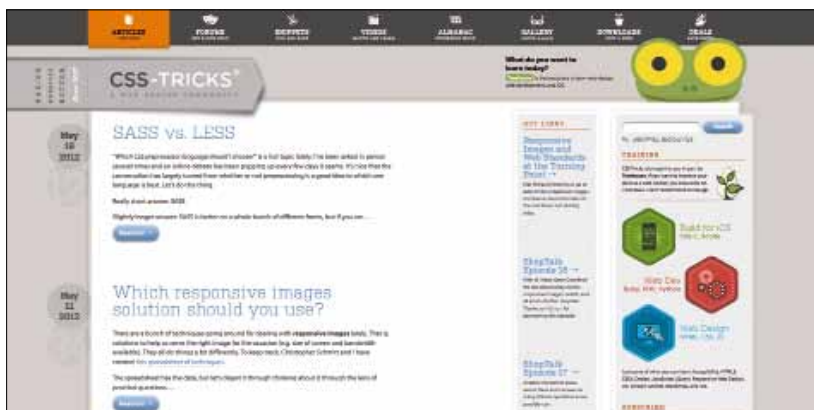
Große Darstellung für Desktop-PCs (Bild 2)

Der herkömmliche Weg, ein Webseiten-Design mit HTML und CSS umzusetzen, ist jedem ein Begriff. Das vorgegebene Design wird in festen Pixelbreiten vermessen und in das Stylesheet